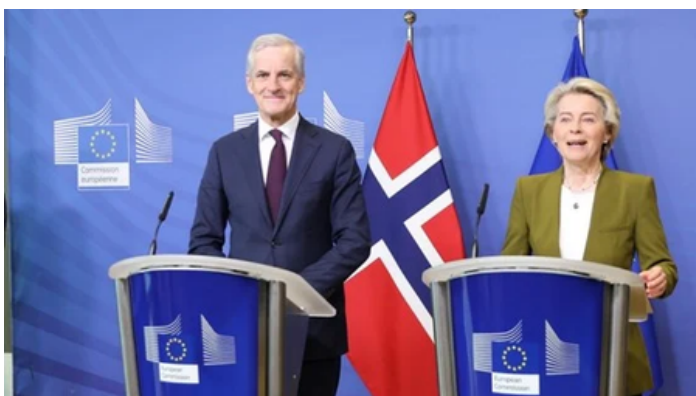
Statsminister Jonas Gahr Støre og Europakommisjonens president Ursula von der Leyen.

Ved Nord-Norges Europakontor følger vi saken, og lover mer oppdateringer når vi vet mer om det konkrete innholdet, spesielt mht. punktet om grønn skipsfart.